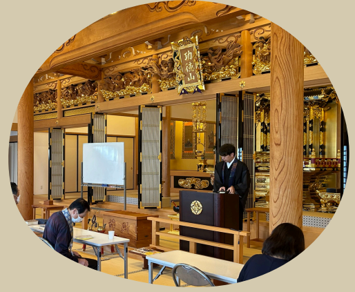
書写した聖教の解説

会場：善重寺 日時：4月より10月までの毎月28日 13時～15時 内容：お勤め（正信偈）・写経・お話 講師：有縁の若手僧侶 会費：一回500円 持ち物：筆ペン、眼鏡（必要な方） TEL：0562-32-2712 ※ご予約不要